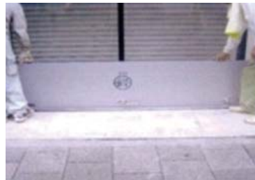
② 止水板を差し込む