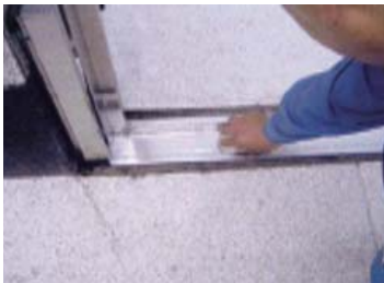
① 敷居カバーを外す