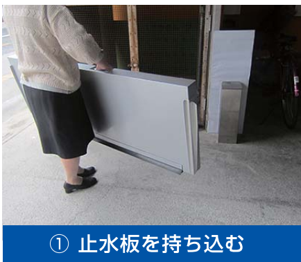
① 止水板を持ち込む