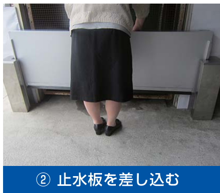
② 止水板を差し込む